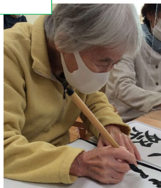
筆を持つと やっぱり昔取った杵柄！